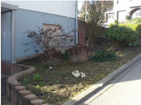
Ist Zustand VORHER

Für die spätere Gestaltung sollten Sie mindestens eine Grobplanung Ihres Steingartens haben. Sammeln Sie Ideen in den Steinakzente Steingärten oder in unseren Gartenfotos in den Impressionen. Machen Sie sich Skizzen und überlegen Sie welche Ziersteinformen, Farben und Größen zum Einsatz kommen könnten. Zierkies und Ziersplitt eignen sich gut für Grundflächen und Wege im Steingarten. Mit Zierschotter lockern Sie größere Flächen auf oder belegen abschüssige Stellen. Gabionensteine eignen sich nicht nur als Füllung in Gabionenkörben sondern in Kombination mit großen Steinen wie Bruchsteinen und mit den richtigen Steingartenpflanzen bilden sie Alpine oder mediterrane Regionen natürlich nach. Mit der Steinakzente Fotoplanung können wir Ihnen die Gestaltung erleichtern wir machen Ihnen fotorealistic Gestaltungsvorschläge mit Ihrem bestehenden Gartenanlagen als Vorlage. Weitere Tipps zur Gestaltung und Hintergründe zu Steingärten finden Sie in unserem Blog zur Gartengestaltung .