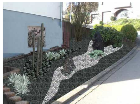
Vorschau Fotoplanung NACHHER